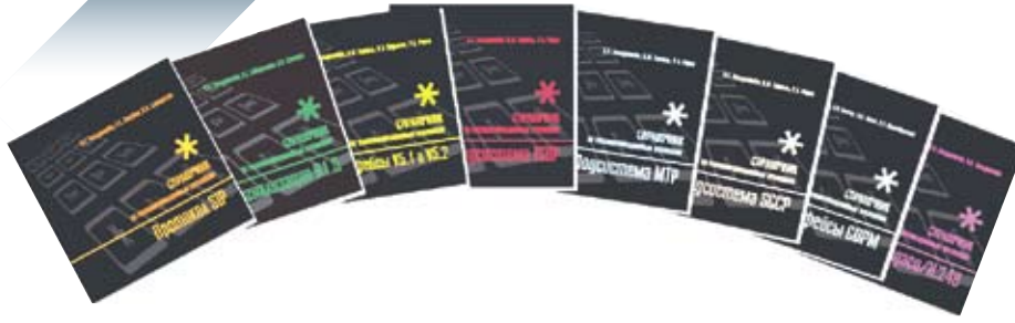
Серия книг «Телекоммуникационные протоколы»

не собирался. Но как тогдашние организационные формы совместить с сегодняшним телекоммуникационным рынком?